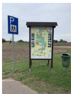
Wanderweg "Plötzkauer Auenwald"