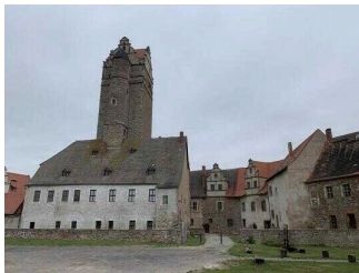
Mittelalterliche Burganlage Plötzkau