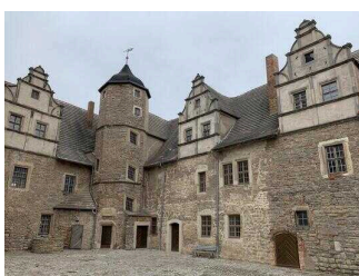
Mittelalterliche Burganlage Plötzkau