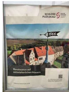
Mittelalterliche Burganlage Plötzkau