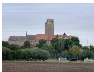
Wanderweg "Plötzkauer Auenwald"