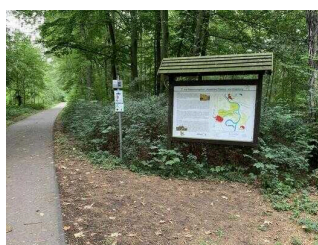
Wanderweg "Plötzkauer Auenwald"