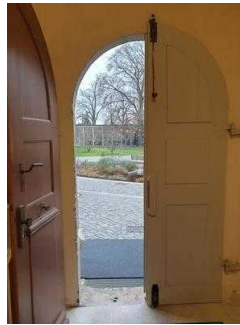
Haupteingang zum Restaurant