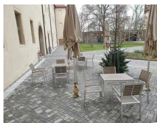
Weg vom Tordurchgang zum Nebeneingang