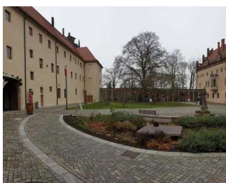
Weg vom Tordurchgang zum Haupteingang