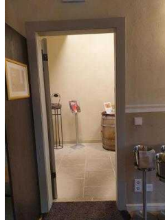
Gastraum "von Bora"