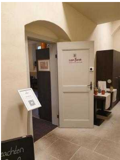
Eingang in den Gasträum