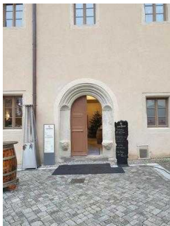
Haupteingang zum Restaurant