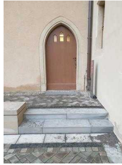
Stufen zum Nebeneingang