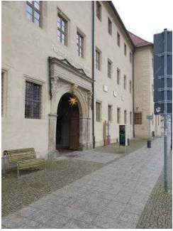
Tordurchgang zum Innenhof