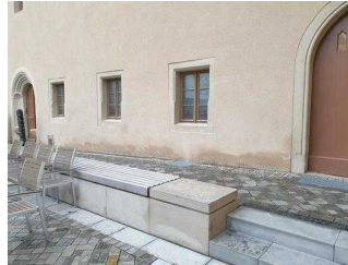
Nebeneingang zum Restaurant