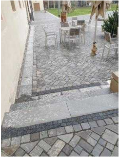
Stufen zum Nebeneingang