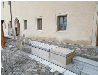
Weg vom Haupteingang zum Nebeneingang