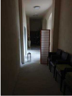
Weg vom Restaurant zum WC