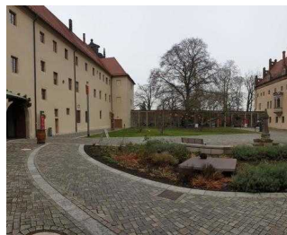
Weg außen vom Tordurchgang zum Eingang von Bora Restaurant