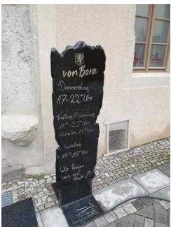
Haupteingang zum Restaurant