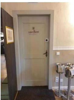
Eingang in den Gasträum