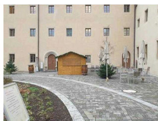
Weg vom Tordurchgang zum Haupteingang