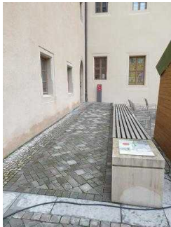
Nebeneingang zum Restaurant