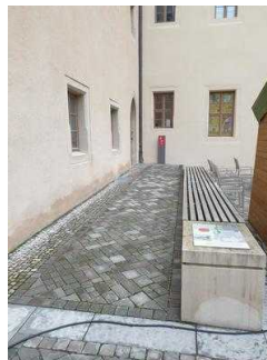
Rampe zum Nebeneingang