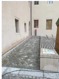
Weg vom Haupteingang zum Nebeneingang