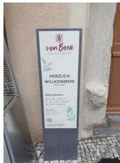
Haupteingang zum Restaurant