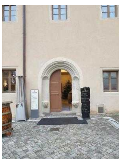
von Bora – Restaurant im Lutherhaus in Wittenberg, Haupteingang