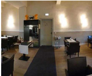
Gastraum "von Bora"