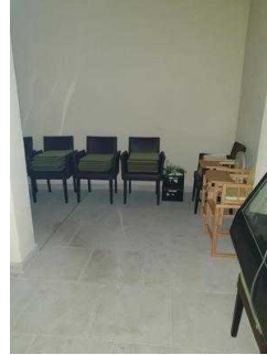
Weg vom Restaurant zum WC