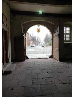
Weg außen vom Tordurchgang zum Eingang von Bora Restaurant