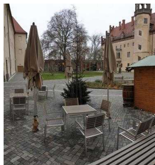
von Bora – Restaurant im Lutherhaus in Wittenberg, Außengastronomie