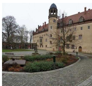
von Bora – Restaurant im Lutherhaus in Wittenberg, Innenhof Lutherhaus