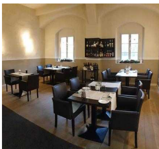
von Bora – Restaurant im Lutherhaus in Wittenberg