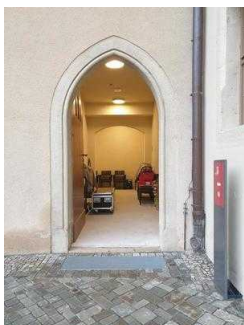
Nebeneingang zum Restaurant