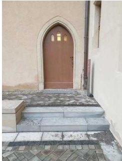
Nebeneingang zum Restaurant