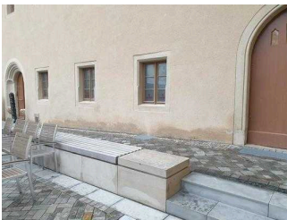
Rampe zum Nebeneingang