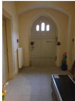
Nebeneingang zum Restaurant