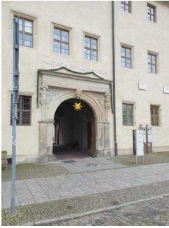
Weg außen vom Tordurchgang zum Eingang von Bora Restaurant