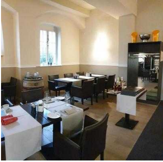
Gastraum "von Bora"