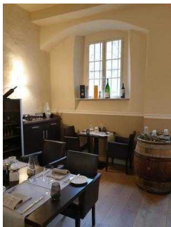
Gastraum "von Bora"