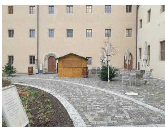
Weg vom Tordurchgang zum Nebeneingang (rechts)