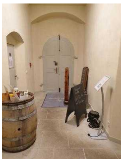
Weg vom Haupteingang zum Gastraum