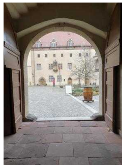
Weg außen vom Tordurchgang zum Eingang von Bora Restaurant