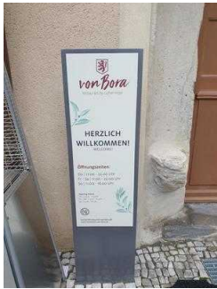
Haupteingang zum Restaurant