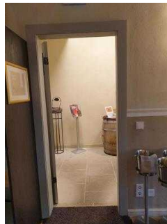
Eingang in den Gasträum