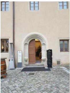
Haupteingang zum Restaurant