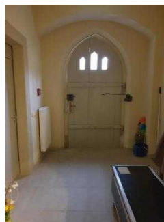
Nebeneingang zum Restaurant