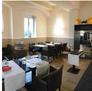
Gastraum "von Bora"