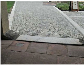
Weg außen vom Tordurchgang zum Eingang von Bora Restaurant