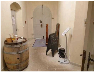
Gastraum "von Bora"