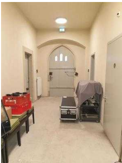
Weg vom Nebeneingang zum öffentlichen WC