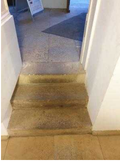
1. Treppe innen zwischen Eingang Schlossseite und Gartenreich Information