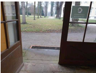
Stufen am Eingang Küchengebäude (Schlossseite)