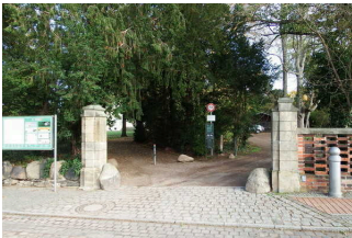
Parkeingang an der Kirchgasse

Der Eingangsbereich ist nicht visuell kontrastreich zur Umgebung abgesetzt.