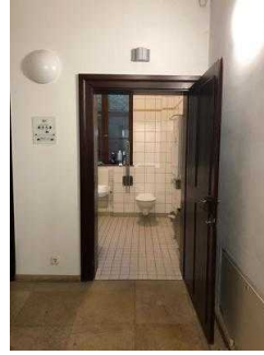
Öffentliches WC für Menschen mit Behinderung