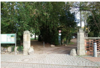
Parkeingang an der Kirchgasse

Der Eingangsbereich ist nicht visuell kontrastreich zur Umgebung abgesetzt.