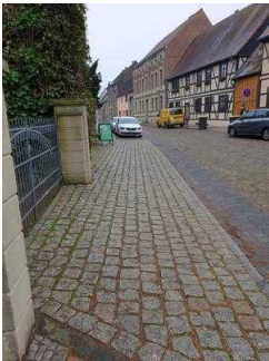
Weg vom Parkplatz Kirchgasse zum Parkeingang