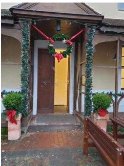
Eingang ins Küchengebäude zur Gartenreich Information (Kirchhofseite)