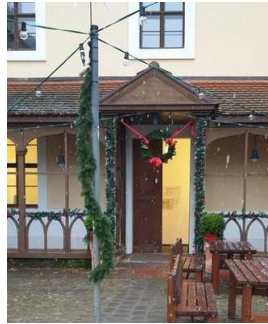
Eingang ins Küchengebäude zur Gartenreich Information (Kirchhofseite)