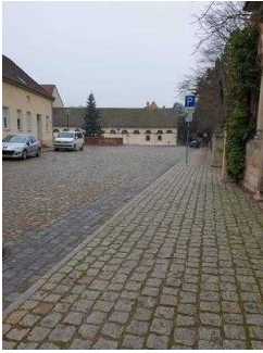
Weg vom Parkplatz Kirchgasse zum Parkeingang