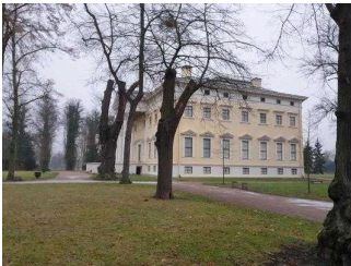
Blick aufs Wörlitzer Schloss