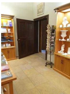
Weg von der Eingangstür zur Kasse