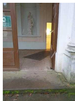
Schlossseite: Flur zwischen Eingang und 1. Treppe Richtung Gartenreich Information und WC