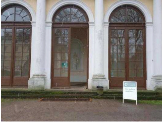
Stufen am Eingang Küchengebäude (Schlossseite)