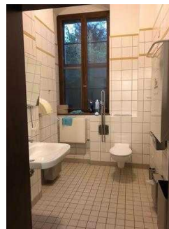
Öffentliches WC für Menschen mit Behinderung