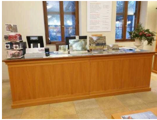
Kassentresen in der Gartenreich Information