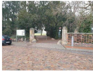
Weg vom Parkplatz Kirchgasse zum Parkeingang