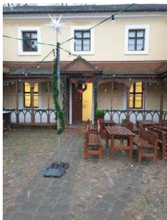
Gartenreich Information im Wörlitzer Park