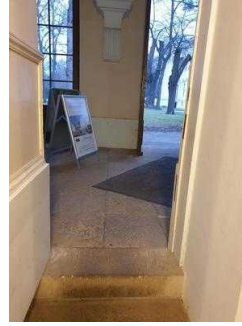
1. Treppe innen zwischen Eingang Schlossseite und Gartenreich Information