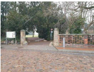
Eingang zur Gartenreich Information (Schlosseite)