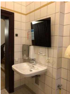
Öffentliches WC für Menschen mit Behinderung