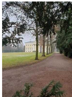
Eingang zur Gartenreich Information (Schlosseite)