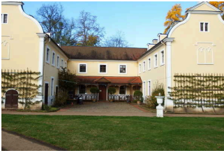
Eingang von der Rückseite des Küchengebäudes