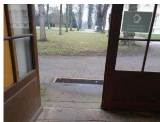
Schlosseite: Eingang ins Küchengebäude