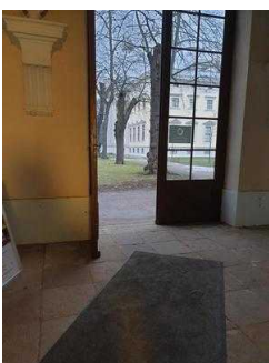
Schlossseite: Flur zwischen Eingang und 1. Treppe Richtung Gartenreich Information und WC