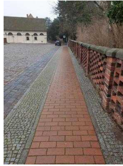
Weg vom Parkplatz Kirchgasse zum Parkeingang