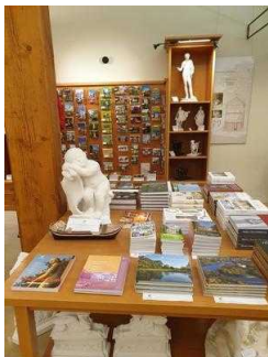
Gartenreich Information im Wörlitzer Park