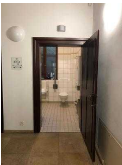
Öffentliches WC für Menschen mit Behinderung