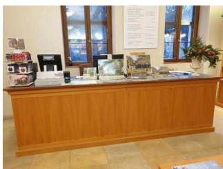
Tresen in der Gartenreich Information