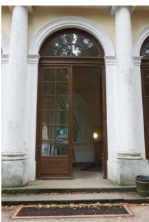
Eingang ins Küchengebäude / Seite zum Schloss