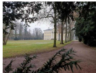
Gartenreich Information im Wörlitzer Park