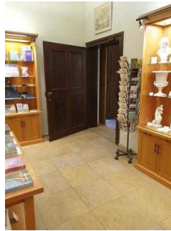
Kassentresen in der Gartenreich Information