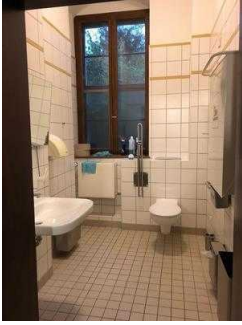
Öffentliches WC für Menschen mit Behinderung