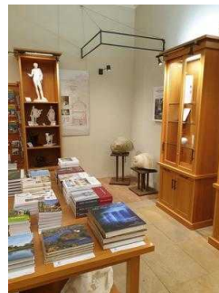
Gartenreich Information im Wörlitzer Park