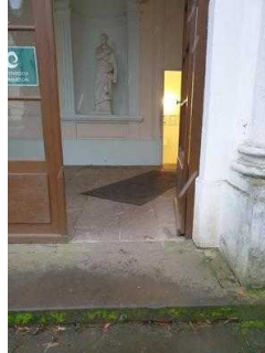
Stufen am Eingang Küchengebäude (Schlossseite)