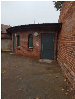
Öffentliches WC im Burggarten