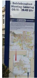
Haltestelle für Rufbus