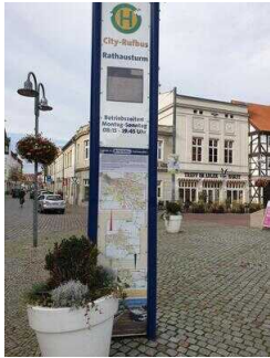
Haltestelle für Rufbus