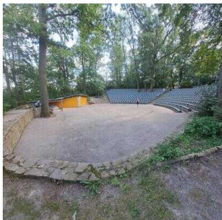
Zuschauerränge im Amphitheater