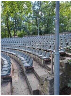
Amphitheater Bierer Berg – Schönebecker Operettensommer