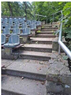
Treppe zwischen den Sitzreihen