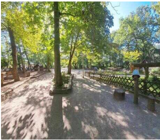
Weg vom Drehkreuz Eingang Heimattiergarten zur Kasse