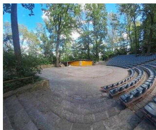
Amphitheater Bierer Berg – Schönebecker Operettensommer