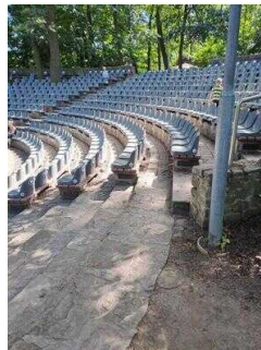
Zugang zu Reihe 4