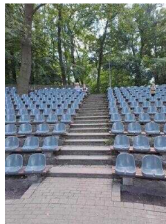
Treppe zwischen den Sitzreihen