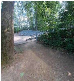
Weg zum stufenlosen Zugang Reihe 4