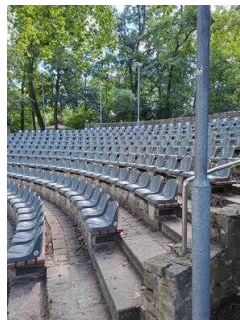
Zuschauerränge im Amphitheater