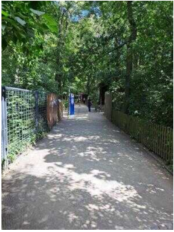
Weg vom Drehkreuz Eingang Heimattiergarten zur Kasse