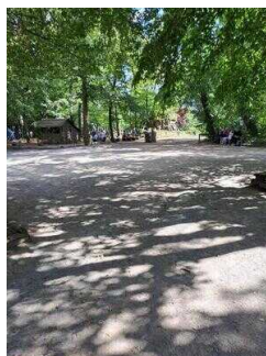
Weg durch den Heimatgarden Bierer Berg