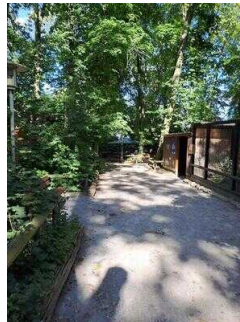
Weg vom Drehkreuz Eingang Heimattiergarten zur Kasse