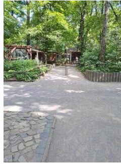
Weg vom Drehkreuz Eingang Heimattiergarten zur Kasse