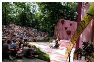
Amphitheater Bierer Berg