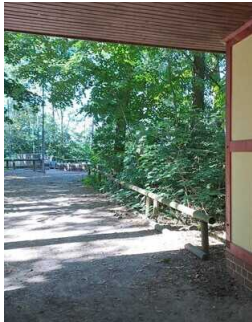
Weg von der Kasse zu den Rängen