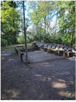
Stellflächen für RollstuhlfahrerInnen und Begleitpersonen