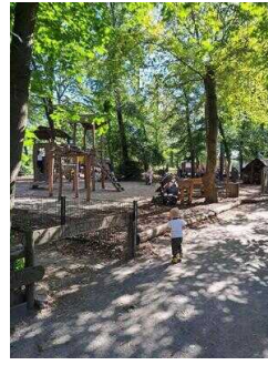
Spielplatz im Heimattiergarten