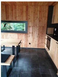
Weg im Haus