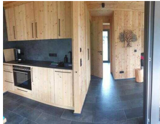
Weg im Haus