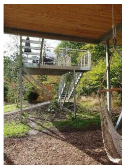
Treppe am Haus