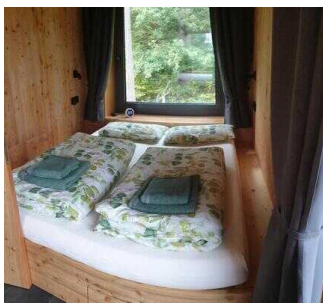
Bett links im Raum