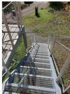
16 Stufen von der Zuwegung zur 1. Terrasse