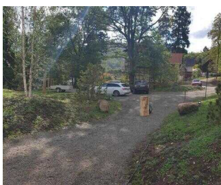
Weg vom Parkplatz zum Haus Westerklippe