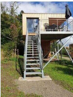
Treppe am Haus