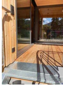
Weg von der Treppe zum Eingang