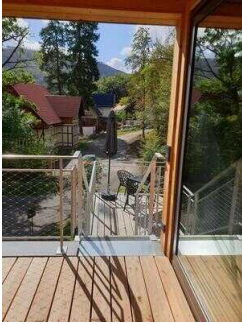
Weg von der Treppe zum Eingang