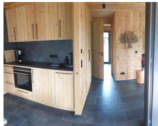
Weg im Haus