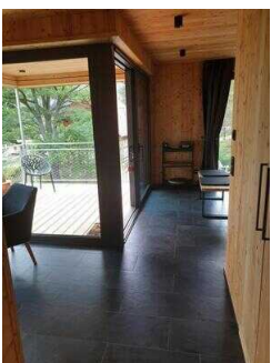
Weg im Haus