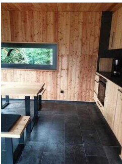
Weg im Haus