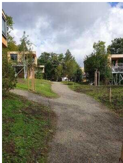
Weg vom Parkplatz zum Haus Westerklippe