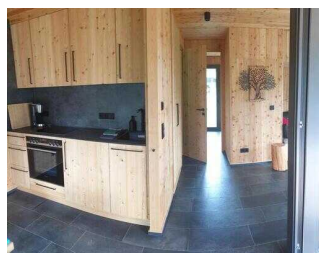
Weg im Haus