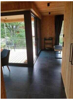
Weg im Haus