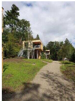
Weg vom Parkplatz zum Haus Westerklippe