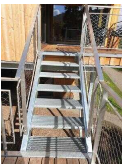
6 Stufen von der 1. Terrasse zur 2. Terrasse mit Hauseingang