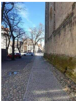
Stadtrundgang – Außenweg