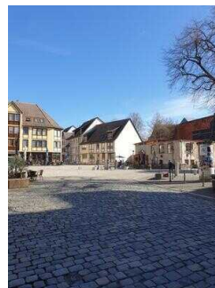
Stadtrundgang – Außenweg