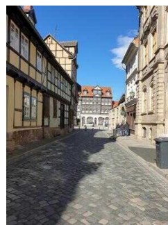
Stadtrundgang – Außenweg