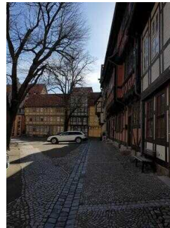
Stadtrundgang – Außenweg