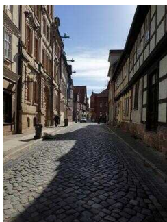
Stadtrundgang – Außenweg