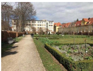
Rosarium im Stadtpark