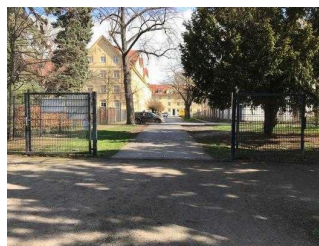
Ein- und Ausgangstore im Stadtpark