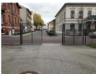
Ein- und Ausgangstore im Park Herrenbreite