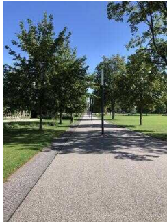
Park Herrenbreite – Beginn der Gartenroute