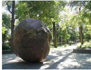
Globus im Stadtpark