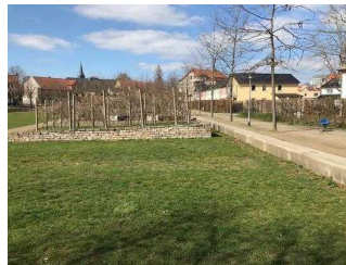
Weg entlang der Eine-Terrasse zum öffentlichen WC