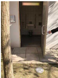
Stadtspark: Eingang WC für Menschen mit Behinderung