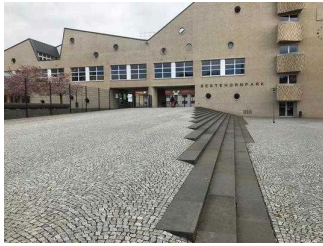
Ausgang Bestehornpark Richtung Stadtpark (Verbindungsweg)