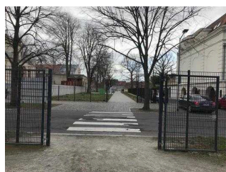
Ein- und Ausgangstore im Park Herrenbreite