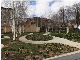
Hauptweg durch den Bestehornpark