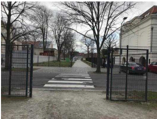
Verbindungsweg (über Straße) zwischen Garten Herrenbreite und Bestehornpark