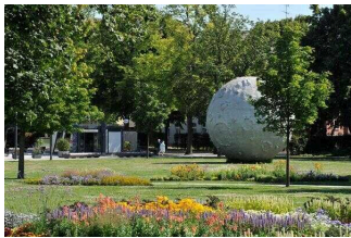
Mond im Park Herrenbreite – Beginn der Gartenroute