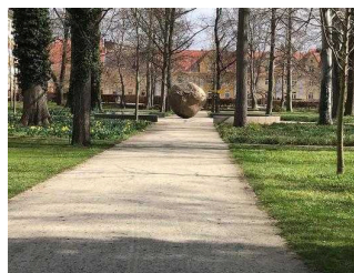
Wegekreuz im Stadtpark