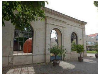
Bestehornpark mit Orangerie