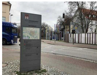
Ampelquerung (hinten Mitte Bild Eingang Stadtpark)