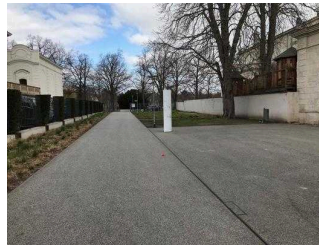
Hauptweg durch den Bestehornpark