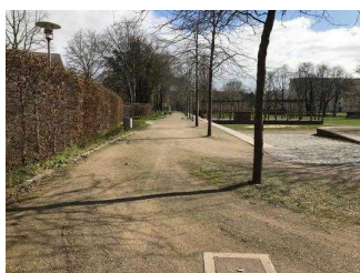
Weg vom Stadtpark entlang der Eine- Terrasse zum öffentlichen WC