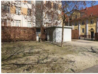
Stadtspark: Eingang WC für Menschen mit Behinderung