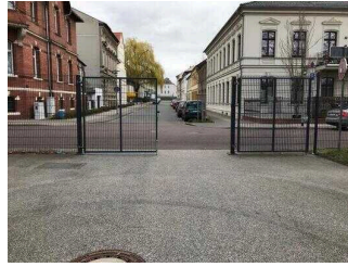
Hauptweg durch den Park Herrenbreite