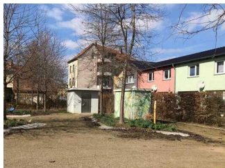
Eine-Terrasse: Eingang öffentliches WC für Menschen mit Behinderung