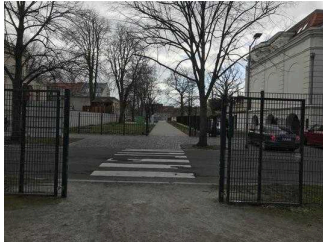
Ein-/Ausgangstor Richtung Bestehornpark