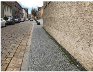
Parkinformation und Parkplätze im Innenstadtbereich von Aschersleben