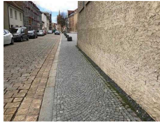
Verbindungsweg zwischen Bestehornpark und Stadtpark / Eine- Terrasse