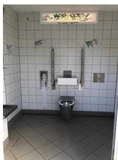
Öffentliches WC für Menschen mit Behinderung an der Eine-Terrasse