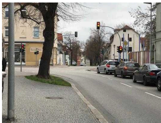
Verbindungsweg über Straße