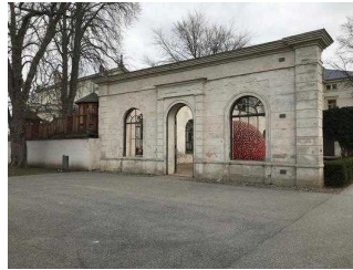
Hauptweg durch den Bestehornpark