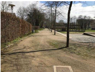
Weg vom Stadtpark entlang der Eine-Terrasse zum öffentlichen WC