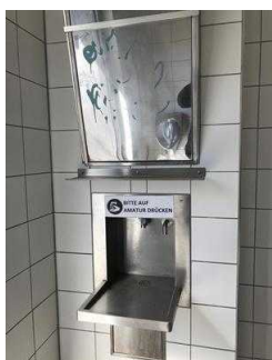
Öffentliches WC für Menschen mit Behinderung an der Eine-Terrasse