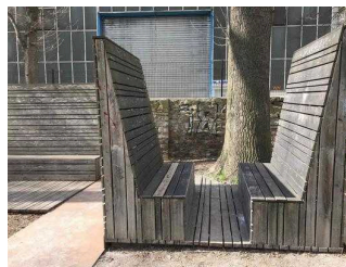
Sitzgelegenheiten im Stadtpark