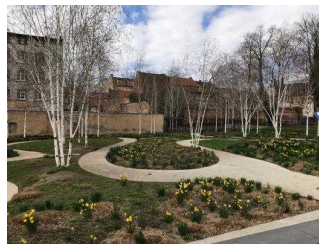
Birkenensemble im Bestehornpark