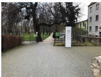
Eingangstor im Stadtpark