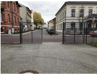
Parkinformation und Parkplätze im Innenstadtbereich von Aschersleben