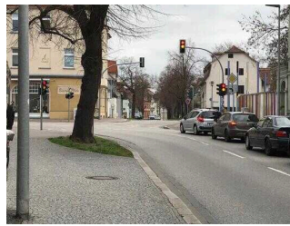
Parkinformation und Parkplätze im Innenstadtbereich von Aschersleben