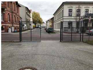
Ein- und Ausgangstore im Park Herrenbreite