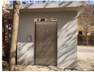
Stadtspark: Eingang WC für Menschen mit Behinderung