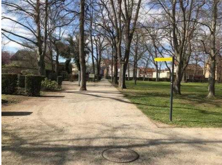
Weg vom Stadtpark zum Bereich Eine-Terrasse