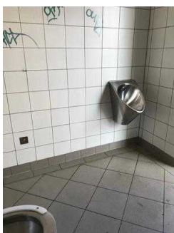
Öffentliches WC für Menschen mit Behinderung im Stadtspark