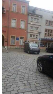
Parkinformation und Parkplätze im Innenstadtbereich von Aschersleben