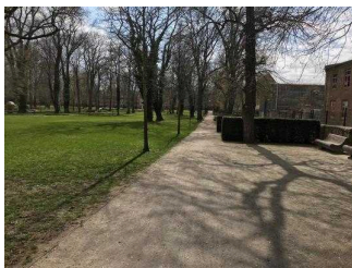
Hauptweg durch den Stadtpark