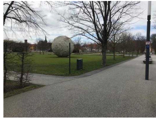
Haupt- und Nebenwege durch den Park Herrenbreite