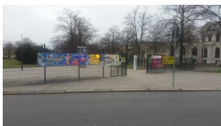
Eingangsbereich Park Herrenbreite