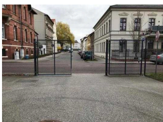
Ein- und Ausgangstore im Park Herrenbreite