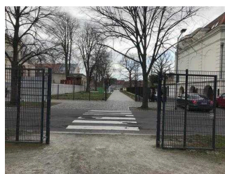
Ein- und Ausgangstore im Park Herrenbreite