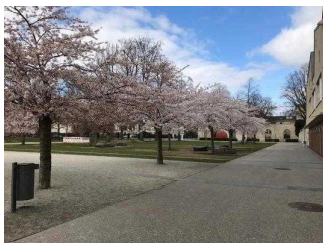
Hauptweg durch den Bestehornpark