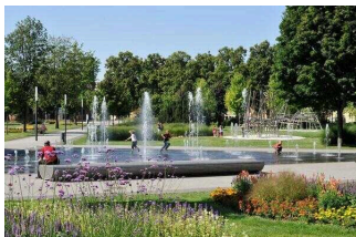
Fontänenfeld im Park Herrenbreite