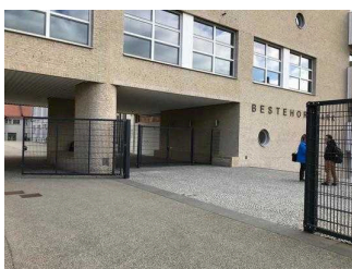
Ein- und Ausgangstor im Bestehornpark