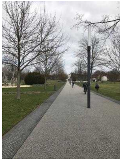
Hauptweg durch den Park Herrenbreite