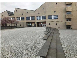
Treppen auf dem Verbindungsweg zwischen Bestehornpark und Stadtpark