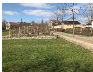
Weg entlang der Eine-Terrasse zum öffentlichen WC