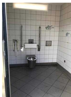
Öffentliches WC für Menschen mit Behinderung im Stadtspark