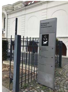
Wegweiser auf dem Verbindungsweg