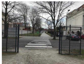
Ein- und Ausgangstore im Park Herrenbreite