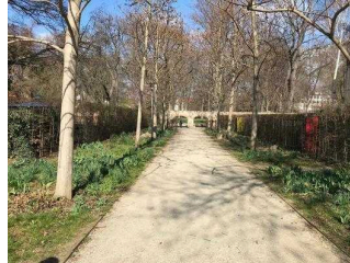
Weg vom Stadtpark zum Bereich Eine-Terrasse