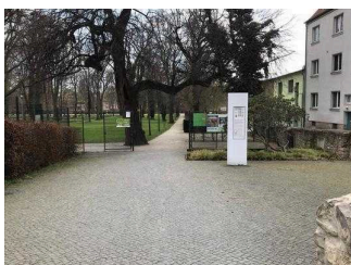
Eingangstor im Stadtpark