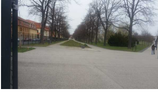
Parkplätze im Innenstadtbereich von Aschersleben