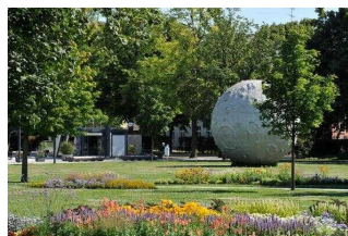
Mond im Gartenträume-Park Herrenbreite