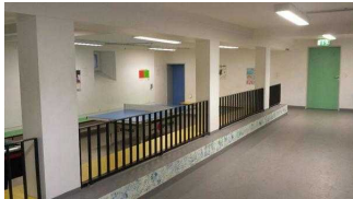
UG: Freizeitbereich – Tischtennis, Billard