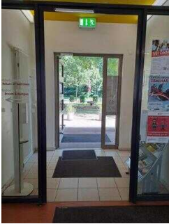
Tür Windfang innen