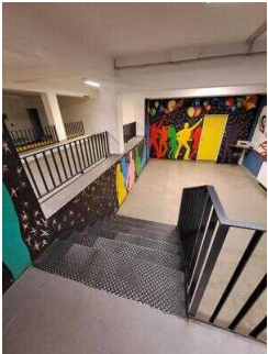
Treppe zum Discobereich