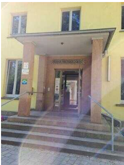
Treppe zum Haupteingang