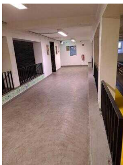
UG: Freizeitbereich – Tischtennis, Billard