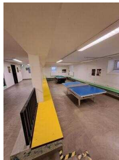
UG: Freizeitbereich – Tischtennis, Billard