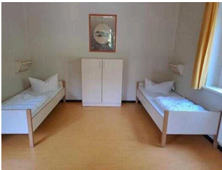
Zimmer Nr. 1