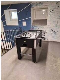
UG: Freizeitbereich – Tischtennis, Billard