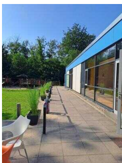
Weg über Terrasse zum Spielplatz