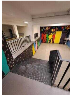
UG: Freizeitbereich – Disco