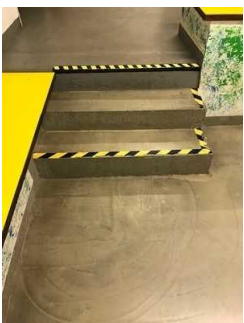
Treppe zum Freizeitbereich