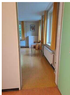
Zimmer Nr. 1