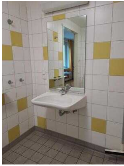
Bad im Zimmer Nr. 1