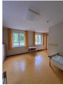
Zimmer Nr. 1