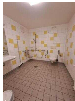
Bad im Zimmer Nr. 1