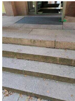
Treppe zum Haupteingang