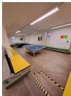
Treppe zum Freizeitbereich (nur über Stufen erreichbar)