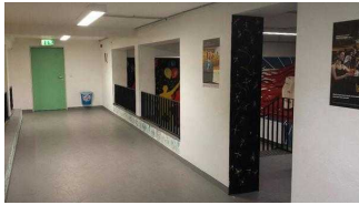
Zugang zum Discobereich