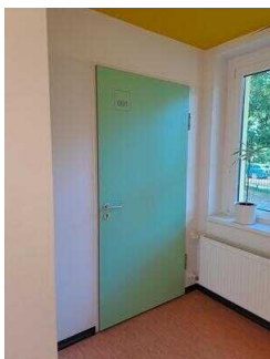
Zimmer Nr. 1