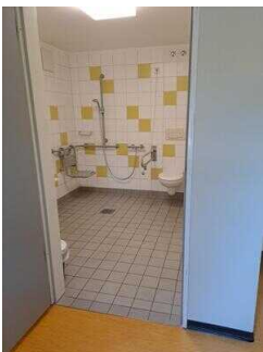
Bad im Zimmer Nr. 1