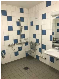
Bad im Zimmer Nr. 2