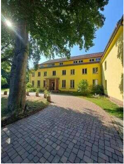
Weg vom Parkplatz zum Haupteingang