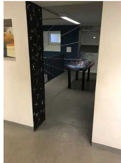
UG: Freizeitbereich – Tischtennis, Billard