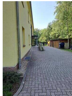
Weg vom Parkplatz zum Nebeneingang mit Rampe