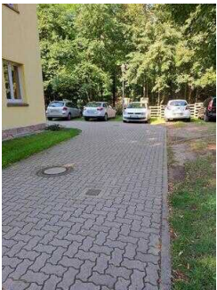
Weg vom Parkplatz zum Nebeneingang mit Rampe