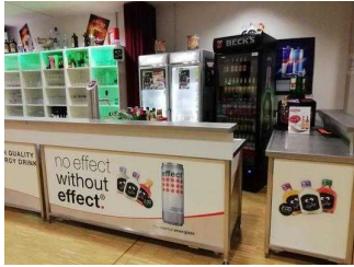
Bartresen im Veranstaltungssaal