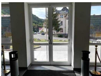
Weg vom Eingang zum Kassentresen