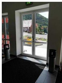
Weg vom Eingang zum Kassentresen