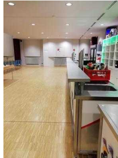
Bartresen im Veranstaltungssaal