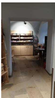
Prospektraum mit Beratungstisch