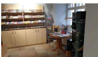
Prospektraum mit Beratungstisch