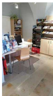
Prospektraum mit Beratungstisch