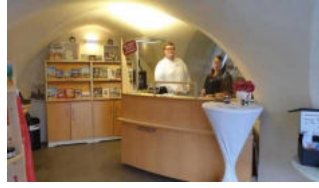
Tourist-Information mit Tresen