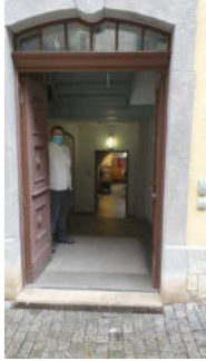
Tür außen zum Nebeneingang WC