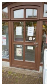
Eingang zur Tourist-Information