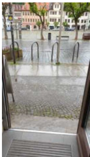
Eingang zur Tourist-Information