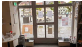
Eingang zur Tourist-Information