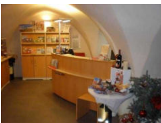
Verkaufs- und Informationsraum