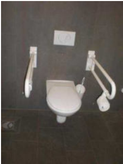
Toilettensitz mit Haltegriffen