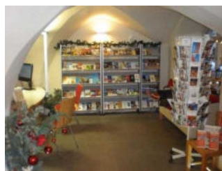
Verkaufs- und Informationsraum