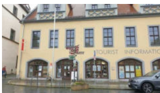
Eingang zur Tourist-Information