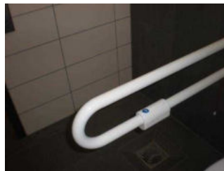
Betätigungstaste für Spülung