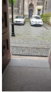
Tür außen zum Nebeneingang WC