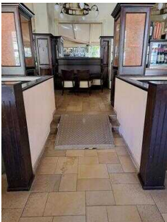
Stufen mit Anlegerampe zwischen Saal und übrigen Gasträumen