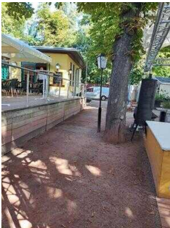
Stufenloser Eingang zum Biergarten