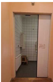
Öffentliches WC für Menschen mit Behinderung