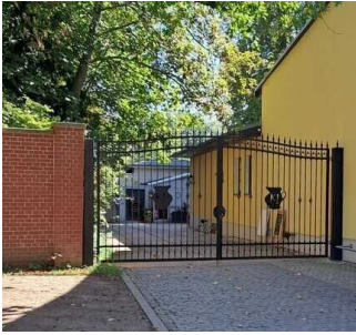
Stufenloser Eingang zum Biergarten