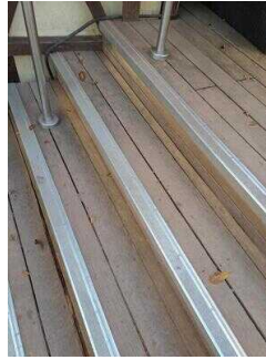
Treppe von der Sonnenterrasse zum Biergarten