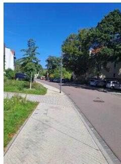
öffentliche Parkplätze an der Straße