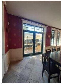
Tür zur Terrasse