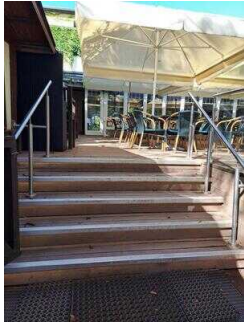
Treppe von der Sonnenterrasse zum Biergarten