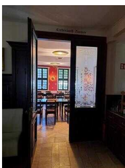
Tür vom Kamin- zum Eichendorff-Zimmer