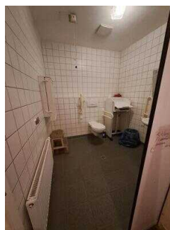
Öffentliches WC für Menschen mit Behinderung