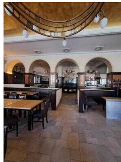
Stufen mit Anlegerampe zwischen Saal und übrigen Gasträumen