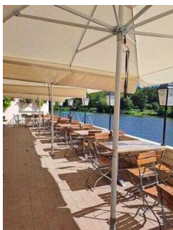
Biergarten direkt an der Saale