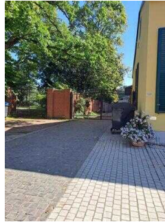
Stufenloser Eingang zum Biergarten