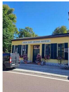
Krug Zum Grünen Kranze