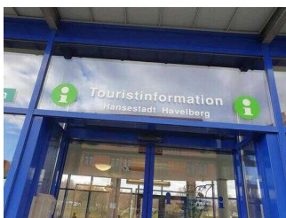
Tourist-Information Havelstadt Havelberg