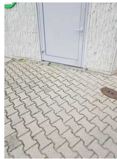
Weg außen von der Touristinformation zum öffentlichen WC