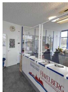
Tourist-Information Havelstadt Havelberg