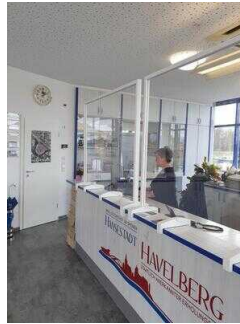
Counter mit Kasse