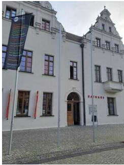
Eingang ins Rathaus