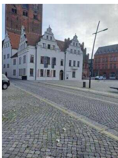
Weg vom Parkplatz zum Eingang