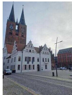
Tourist-Information im Rathaus der Hansestadt Stendal