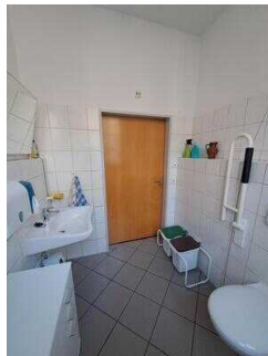
Öffentliches WC für Menschen mit Behinderung