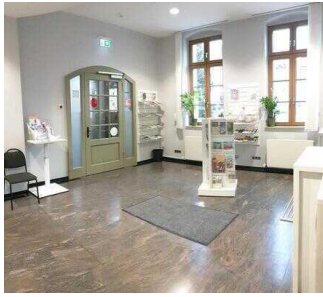
Eingang zur Tourist-Info (innen)