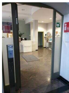
Eingang zur Tourist-Info (innen)