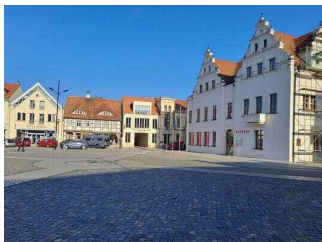
Marktplatz mit Rathaus