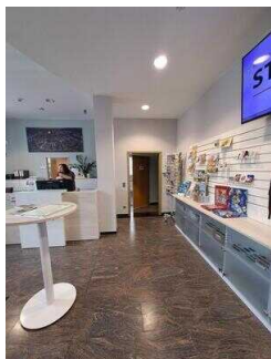
Weg vom Counter zum WC