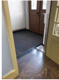
Entrance to the tourist information office (inside)