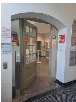
Eingang zur Tourist-Info (innen)