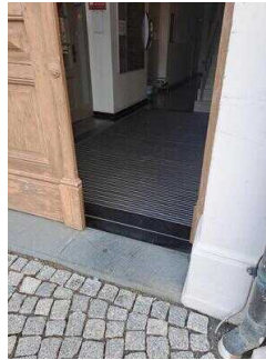
Eingang ins Rathaus