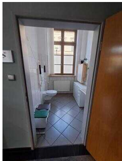
Öffentliches WC für Menschen mit Behinderung