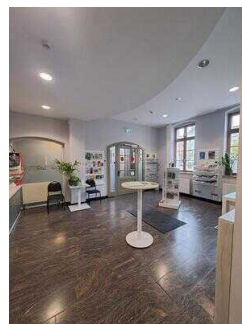
Tourist-Information Hansestadt Stendal