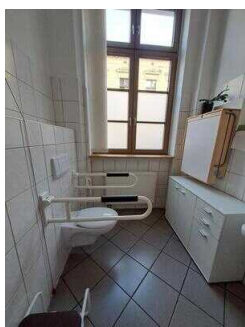
Öffentliches WC für Menschen mit Behinderung