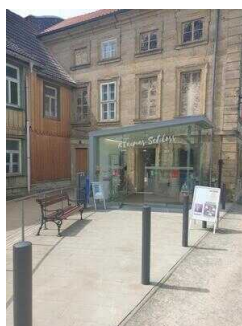
Touristinformation Blankenburg (Harz)