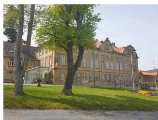
Touristinformation Blankenburg (Harz)