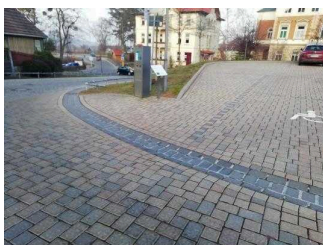
Weg vom Parkplatz über die Straße zum Eingang