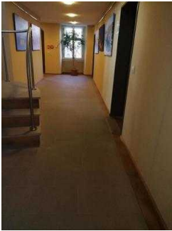
Fläche vor dem WC