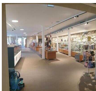
Touristinformation Blankenburg (Harz)