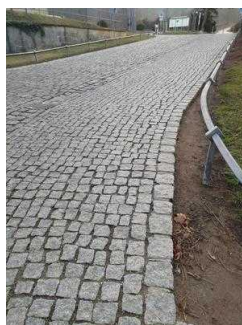
Weg vom Parkplatz über die Straße zum Eingang