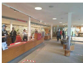
Touristinformation Blankenburg (Harz)