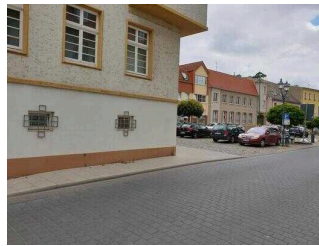
Weg vom Parkplatz zum Eingang WC