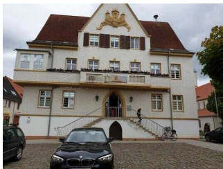
Öffentliches WC im Rathaus der Stadt Barby (Elbe)