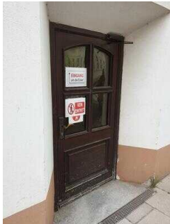
Eingang zum Öffentlichen WC