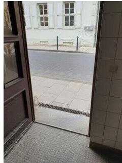
Eingang zum Öffentlichen WC