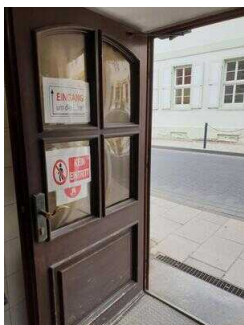
Eingang zum Öffentlichen WC