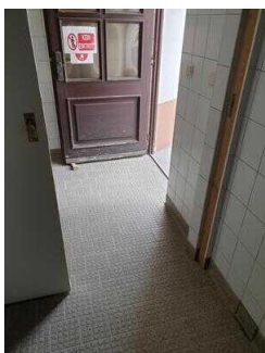
Weg vom Außeneingang zur WC-Tür