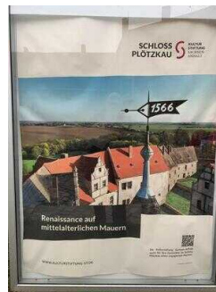
Mittelalterliche Burganlage Plötzkau